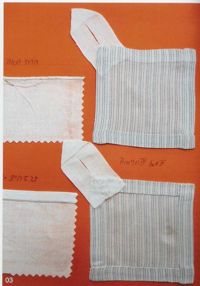
Foto's 01 Fijne open naadjes. 02 Naden versieren. 03 Aanzetten van een lusje. Voor- en achterkant getoond. 04 Richelieu. 05 Vlakvullend borduurwerk met de Roemeense steek. 06 Venetiaans open werk. 07 Perzisch ajour.